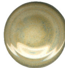
nacheinander: S 414, S 411, S 100