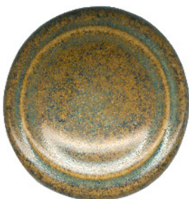
S 411 und S 414 gemischt 5:2