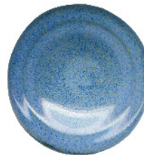
S 205 und S 411 gemischt 3:1 darüber S 100