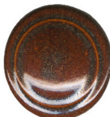
S 414 und S 411 gemischt 2:1