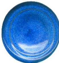
S 205 darüber S 100