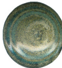
S 411 darüber S 205