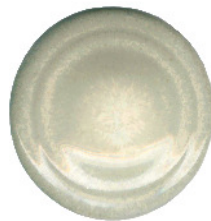
S 411 darüber S 100

Das Starter – Set bietet Ihnen den einfachen Einstieg unsere Produkte kennenzulernen.