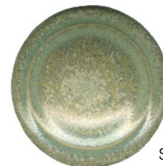
S 411 und S 205 gemischt 5:2