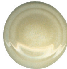
S 411 und S 414 gemischt 5:2 darüber S 100