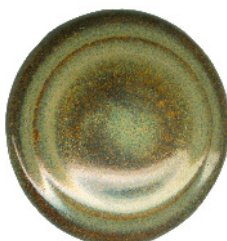
S 414 darüber S 411